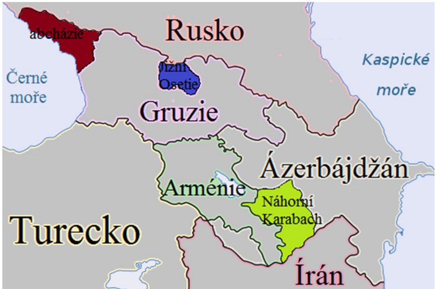
Politická mapa Zakavkazska včetně všech sporných států